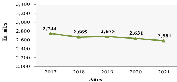
Población 16 años y más en Junio No Ajustado Estacionalmente